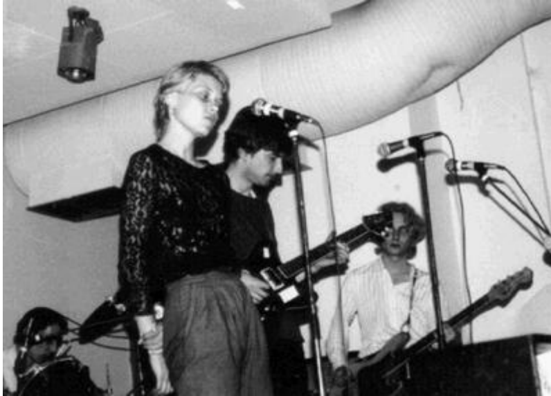
1984.03.31. Trabant koncert a Ráday klubban

Rajztanárunk sem mindig a tér, forma, szín rejtelseire oktatót a gimnáziumban, hanem levetítette Orwell John Halas rendezte Állatfarmját , megkérte az osztályt: „ Ezt azért ne nagyon emlegessék máshol fiatalok, mert ez a rajzfilm be van tiltva. Már mint nálunk. ” Balaton szölt a rajzórán és Trabant (alternatív zenekarok), mindenki azt csinált, amit akart, a tanár történeteket mesélt a katonaságról, miképpen szabotálta a Magyar Néphadsereg előírászerű működését.