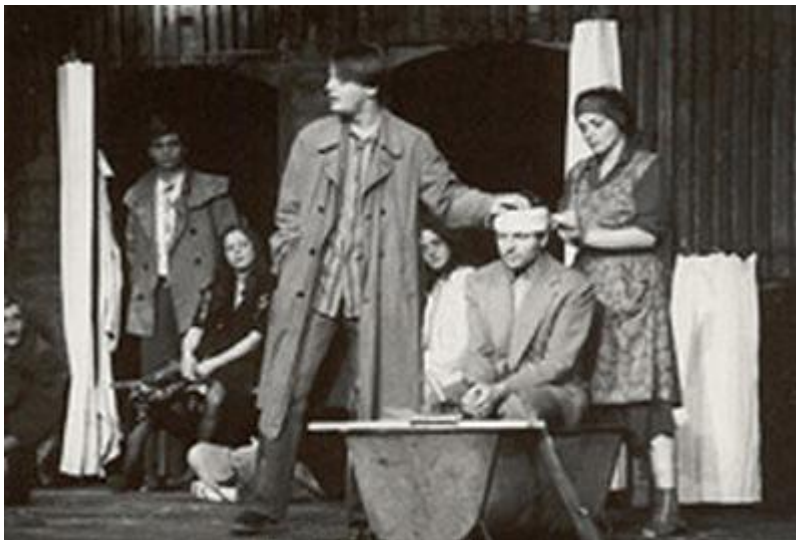
Peter Weiss: Marat/Sade

Rajztanárunk sem mindig a tér, forma, szín rejtelseire oktatót a gimnáziumban, hanem levetítette Orwell John Halas rendezte Állatfarmját , megkérte az osztályt: „ Ezt azért ne nagyon emlegessék máshol fiatalok, mert ez a rajzfilm be van tiltva. Már mint nálunk. ” Balaton szölt a rajzórán és Trabant (alternatív zenekarok), mindenki azt csinált, amit akart, a tanár történeteket mesélt a katonaságról, miképpen szabotálta a Magyar Néphadsereg előírászerű működését.