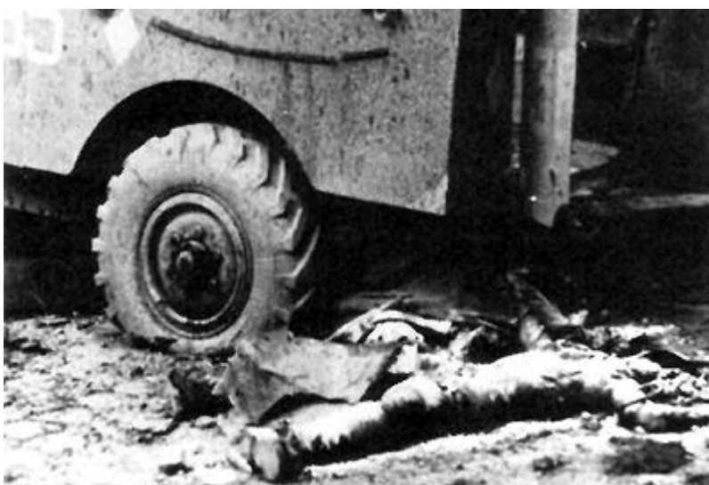
Kilőtt páncélautó halott katonával

utolsó előadások valamelyikét. Egy évvel lemaradtam a Mester és Margaritáról . Láttam az Állatfarmot (már megint az Állatfarm , de akkor már szabad volt játszani). Láttam Eörsi István : Kihallgatását (kétszer is, máig bennem él az, ahogy Karátson Tamás, kihallgatottként kap egy szál cigarettát, és talán egy perc alatt elszívja. Iszonytató mohósággal, a cigarettán át lélegzik, még látom, ahogy a cigarettahamu felizzik és egyre hosszabb lesz, s amint meggömbülve enged a gravitációnak. Látom a bilincseket is. Azt hiszem, sokáig ez jelentette nekem '56-ot. Pár év múlva az egyetemen Karátson Gábor festőt, író-t hallottam beszélni '56-ról, egy momentum él elevenen a történeteiből: a több ezres tömegből be-bekiabáltak: „ Tartsad magad, Jóska! ” (nehezen dőlt le a Generalissimus szobra, és a humor ilyen helyzetben katartikus). És Faludy György hangja is hitelesen cseng a fülemben, ha '56-ról, Recskről esik szó.