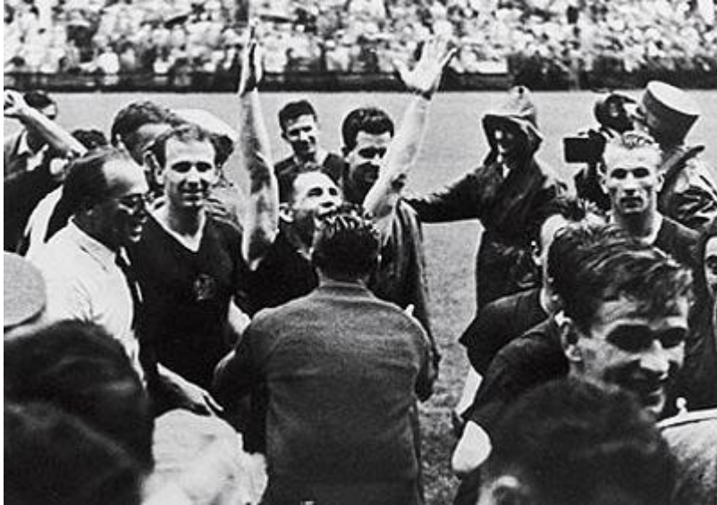
Puskás Ferencet ünneplik

Az, hogy ki minek ad jelentőséget az életében, nagyon sok mindentől függ. Neveltetés, egyéni habitus, társadalmi kapcsolatok, közérzet, csillagállás, széljárás... 1956-ban Magyarországon egy rövid ideig úgy tűnt, együtt lélegzik, egyet akar mindenki, és ezt az akaratot nem kényszeríthette rájuk senki (luftballonokból szórt röplapokkal, rádióadásokkal, és „ürgebőrbe” kötött üzenetekkel biztos nem), illetve éppen a politikai rendszer okozta túlzott kényszerűség váltotta ki az egyet akarást (a diktatúra lelket nyomorító elnyomása). Mára ennek a nagy egységnek nyoma sincs. Még a tények megítélésében sem. '56 ma majdnem ugyanolyan állami ünnepnek számít az iskolákban, mint április 4-e és november 7-e volt egykori szocialista népköztársaságunkban nekünk, akkori kék és vörös nyakkendős kispajtásoknak. Vonulni kellett, vigyázban állni, verseket és beszédeket hallgatni, de legalább az óráról lóghattunk. Október 23-a is egy üres dátummá lett, – ahogy tanárrá lett egykori csoporttársaim, de mostani kisdíjakok is ezt mesélik –, amikor unalmasan komolynak kell lenni, patetikus beszédek, szimbolikus koszorúzások közepette az egyetlen „szórakoztató”, profán elem az évenként ismétlődő politikai bohóctréfa a „301”-es (vagy 302-es, 303-as – ezt is hallottam már, hogy elbizonytalanodott egy nagyon komoly ember, a pontos számot illetően) parcellában, melyről a baloldali, vagy liberális szónokot dühödten kifütyülő szélsőjobbosok gondoskodnak (szentségtörésről a temetőben).